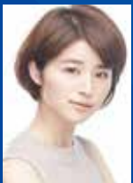
女優・モデル 鈴木 ちなみ氏

1989年生まれ。現在28歳。日本の女性ファッションモデル、タレント。岐阜県多治見市出身。金城学院高校卒業。東海地方では、テルサタ(メ〜テレ)・スタイルプラス(東海テレビ)で司会・スタイルコンシェルジュで活躍中。