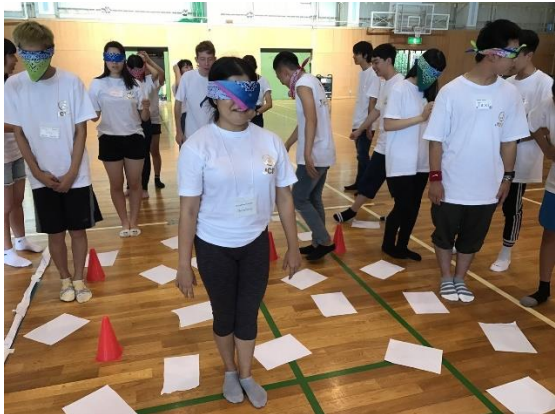
7/27 Limitless Nagoya リーダー研修