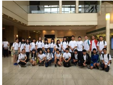
7/30 お別れパーティー