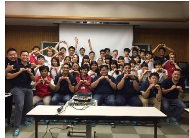
世界へ羽ばたく偉人となれ!