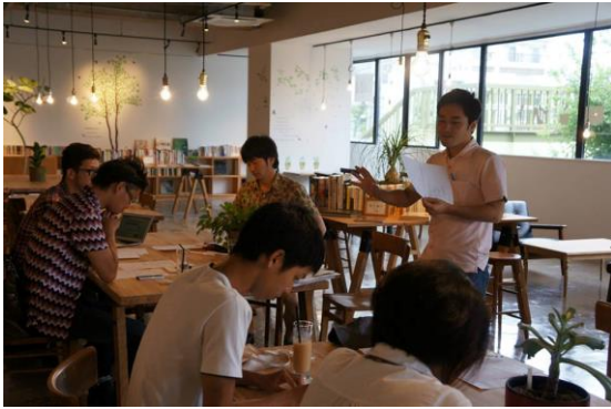
6/23 ディスカッション