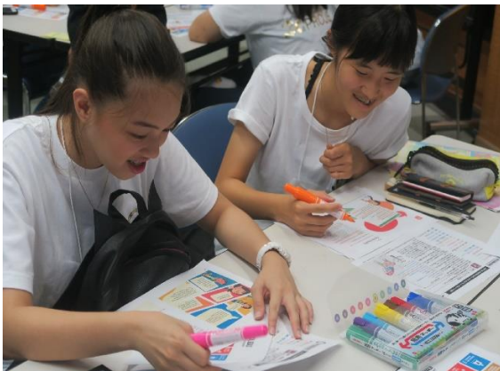
7/28 SDGs Training みんなでまちづくりを考える