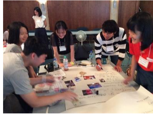
7/7 案内づくり&野外フィールドワーク