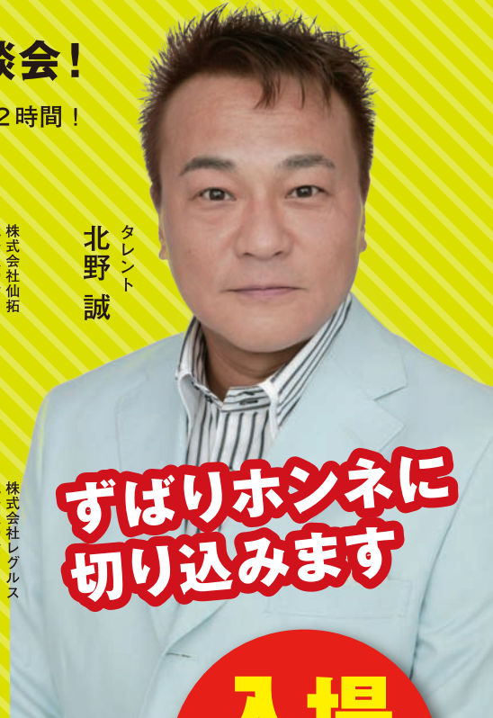
タレント 北野 誠