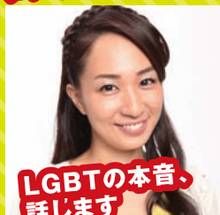
タレント 一ノ瀬 文香